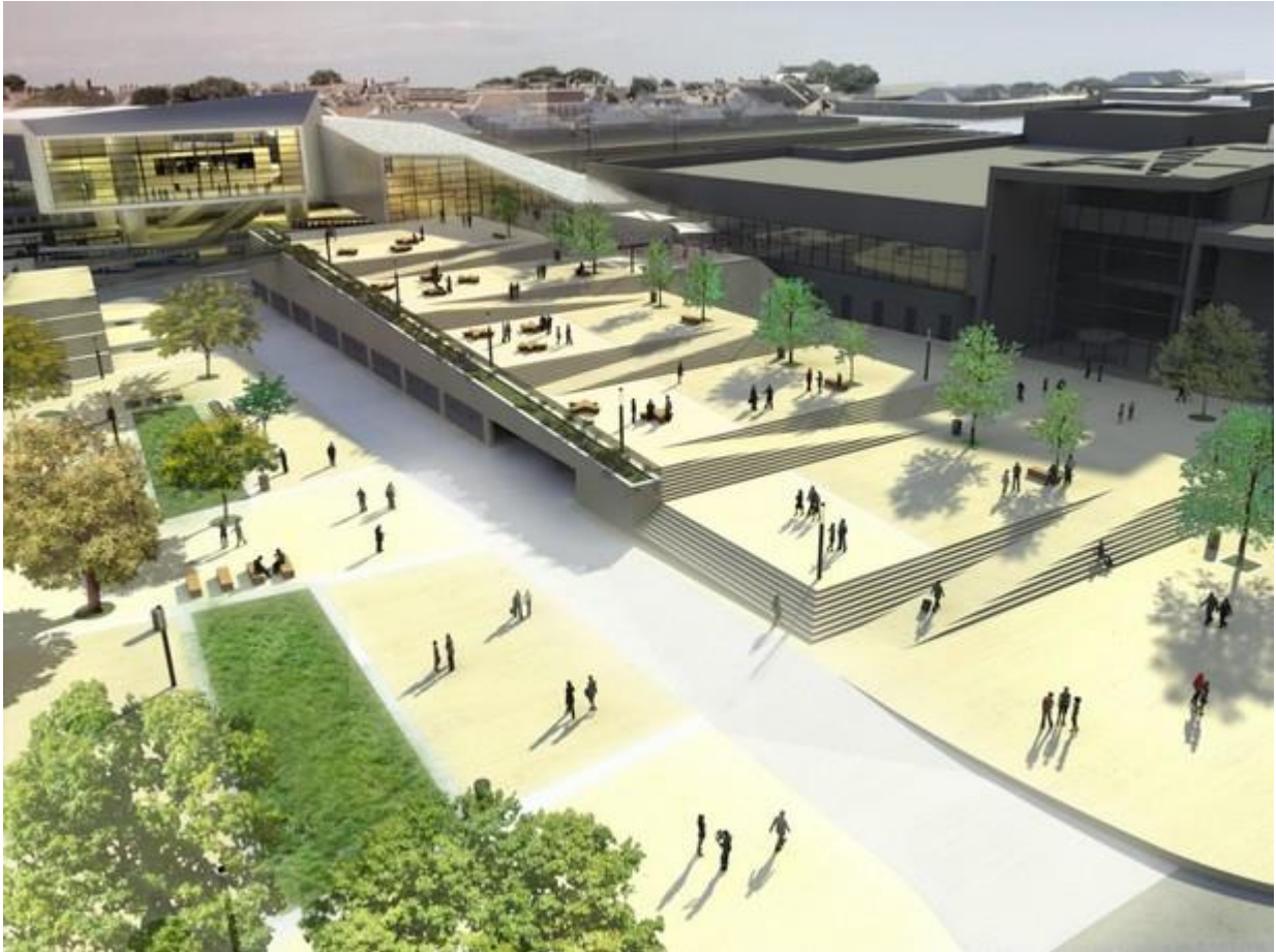
Az új épületegyüttes a Rákóczi út végén. Balra a Vasútkert és a terminál, jobbra a KTE-pálya helyén épülő új pláza.

Mielőtt belekezdenénk, nem árt tisztázni hogy ma már nem csupán városi pletykáról, ötletelésről beszélünk. Mint ismeretes, Kecskemét 3 nyertes közlekedésfejlesztési pályázatot tudhat maga mögött mely rengeteg, összesen több mint 130 milliárd (!) forint vissza nem térítendő uniós támogatást jelent. Ehhez persze nem árt jóban lenni az Unióval... A három támogatott fejlesztés a következő: