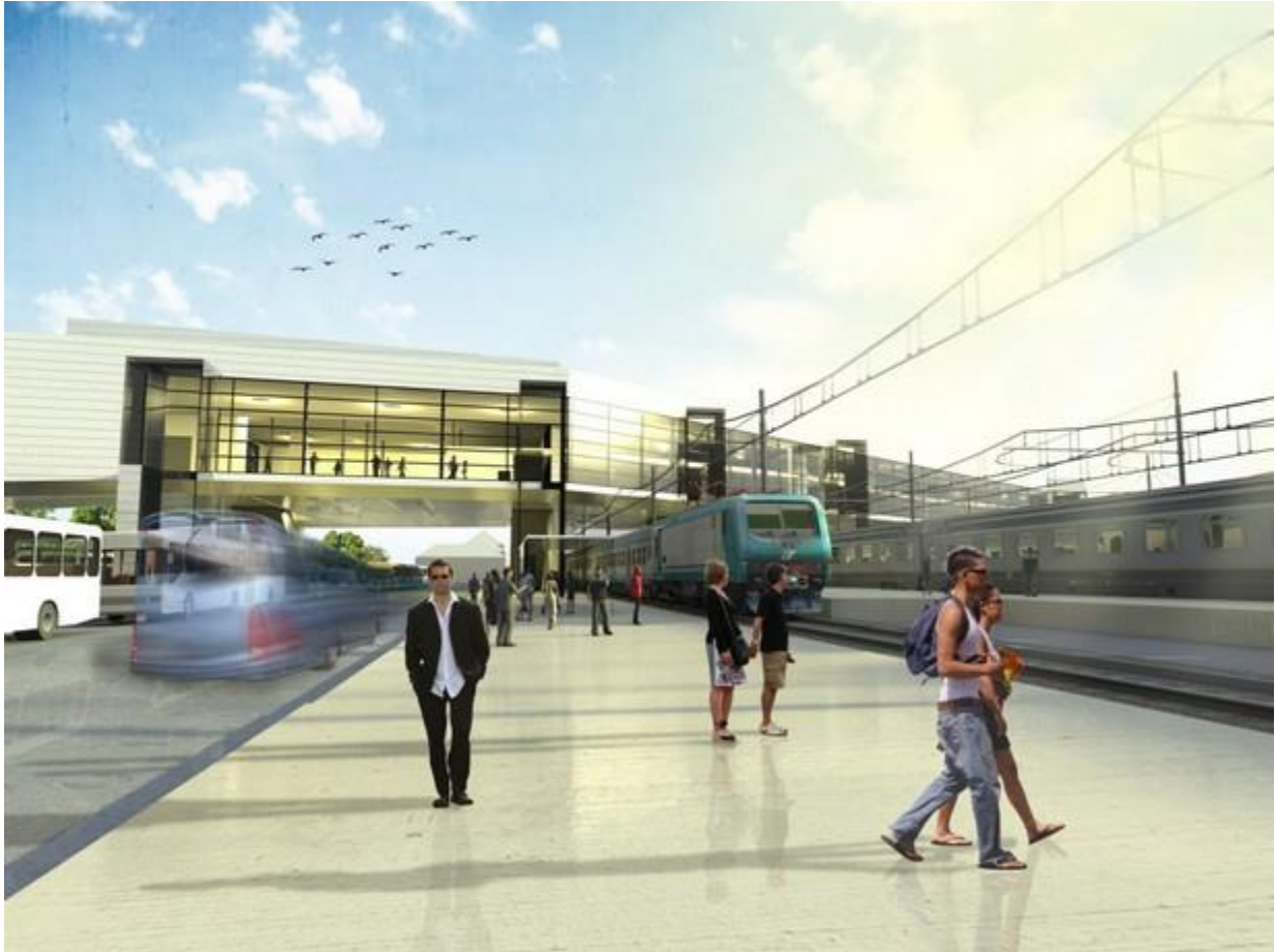
A pályaudvar java a vágányok fölött helyezkedne el. Háttérben a jelenlegi állomás.