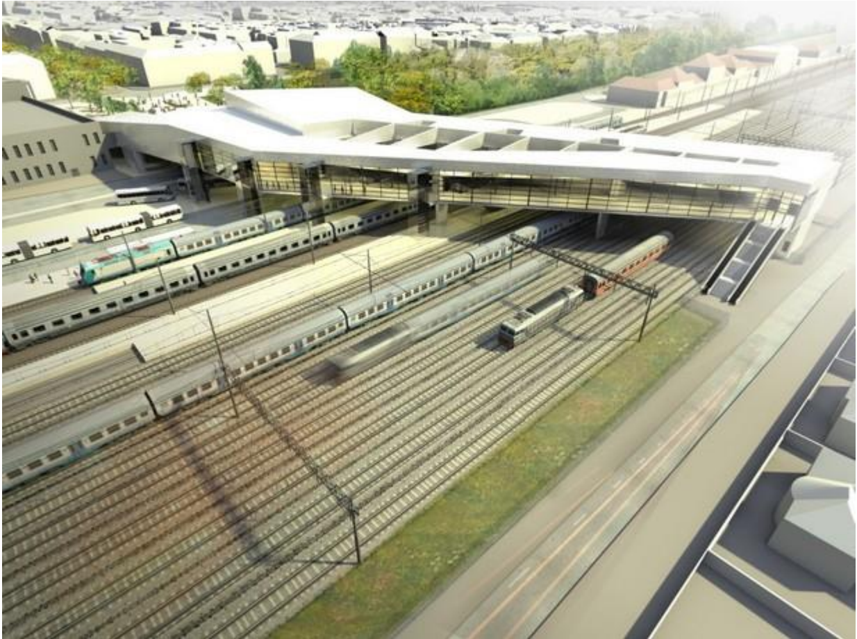
Látkép a Hunyadváros felől. Bal felső sarokban a Rákóczi út.

A beruházás keretében szerepet kap egy új közút is, mely a jelenlegi vasútállomás előtti út folytatásaként, a vasút mellett és pláza mögött haladva részben tehermentesítené a Kuruc körutat. Ugyanitt kapna helyett a Volán új helyi és helyközi részlege, bár egyelőre elképzelni sem tudjuk hogy férne itt el.