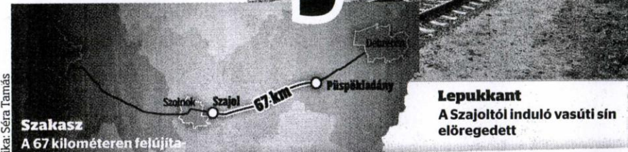
Szakasz A 67 kilométeren felújítanak, építkeznek